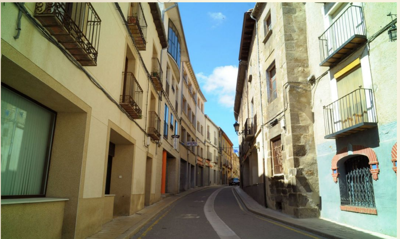
Comienzo de la calle Venerable

Las familias nobiliarias también eligieron esta calle como lu-