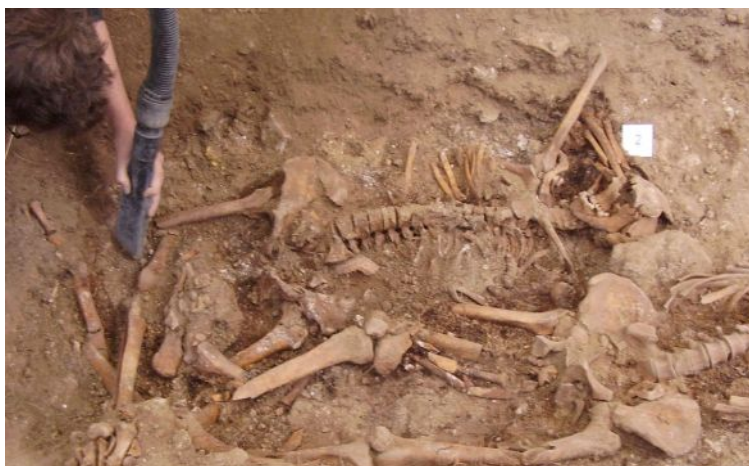
Exhumación de los restos de los aviadores republicanos.

«Dos desconocidos hallados en la Dehesilla, aviadores rojos, el 24 de Agosto de 1937. Fueron enterrados en lo que fue cementerio civil».