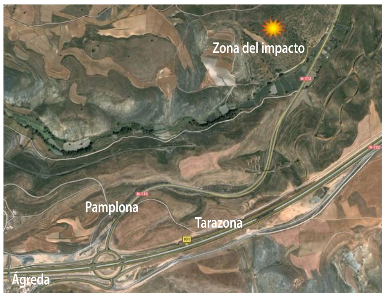
Punto exacto donde cayó derribado el Katiuska situado en el paraje La Dehesilla, de Ágreda

«A finales de Agosto del 37, el ejército de la República con el fin de aliviar la presión nacionalista en el frente del Norte, lanzaba la denominada Batalla de Belchite. Para detener dicha ofensiva, el Grupo 24 de Bombardeo estableció la