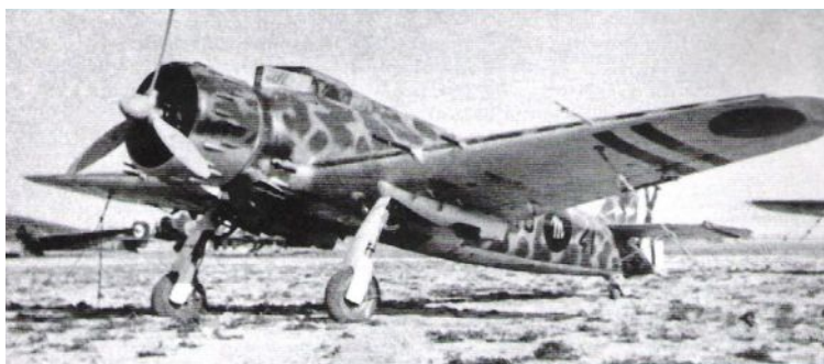
Avión de caza Breda Ba.65, de la 65ª Squadriglia, matrícula 16-41, modelo similar al que abatió al Katiuska sobre Ágreda. En las alas pueden observarse la cuatro ametralladoras Breda SAFAT con que estaba dotado: dos de 7,7 mm y dos de 12,7 mm (SHYCEA)

la noticia de que la guardia civil traía conducido al pueblo al aviador republicano salieron a su encuentro de un lado u otro por las principales