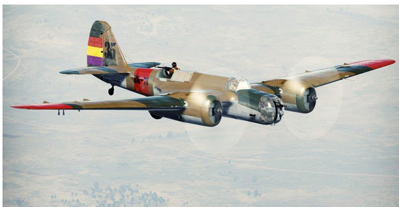
Infografía de un bombardero Tupolev Ant-40 con los colores de la República, también conocido por SB, un modelo similar al que impactó en La Dehesilla. Uno de los aviones más avanzados de su tiempo, tuvo su estreno bélico en la Guerra Civil española, donde se le conoció como «Katiuska».

Al acercarme a ellos ví que no tenían nuestras insignias y en cuanto me avistaron, empezaron a darse a la fuga. Intuitivamente los perseguí y me di cuenta que tenía que atacarlos porque estaba volando específicamente en un vuelo de protección. En un determinado momento disparé una ráfaga, más que nada, para probar, viendo las trazadoras caer mucho antes de llegar al blanco. Por tanto decidí acercarme y cuando estimé que estaba a la distancia correcta, disparé otra ráfaga, dando esta vez en el blanco, impactando en las alas y perforando los tanques de uno de los adversarios, dejando