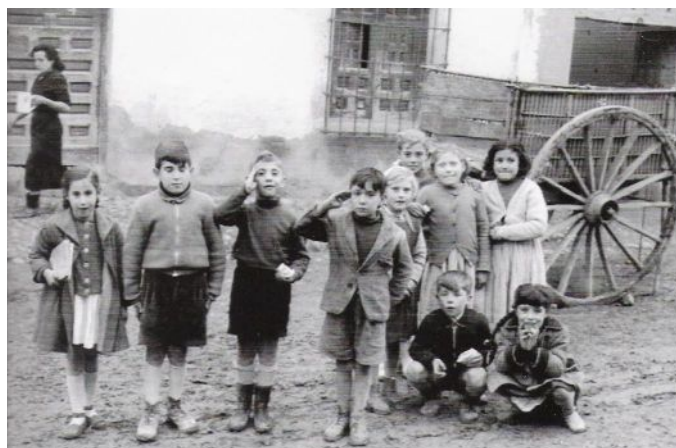
Niños de mi tiempo, de cualquier lugar de España.

En su período de mayor influencia -18 de Julio del 36 a 19 de Abril de 1937- Acción Ciudadana