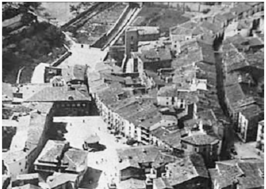
Vista aérea de la Plaza Mayor y sus alrededores, con el torreón situado en las Peñuelas

Una anécdota que ya conté en otra ocasión y que me van a permitir cuente de nuevo, fue la acontecida un día entre el jefe local de Acción Ciudadana, Quintín Peral, y el General Yagüe,