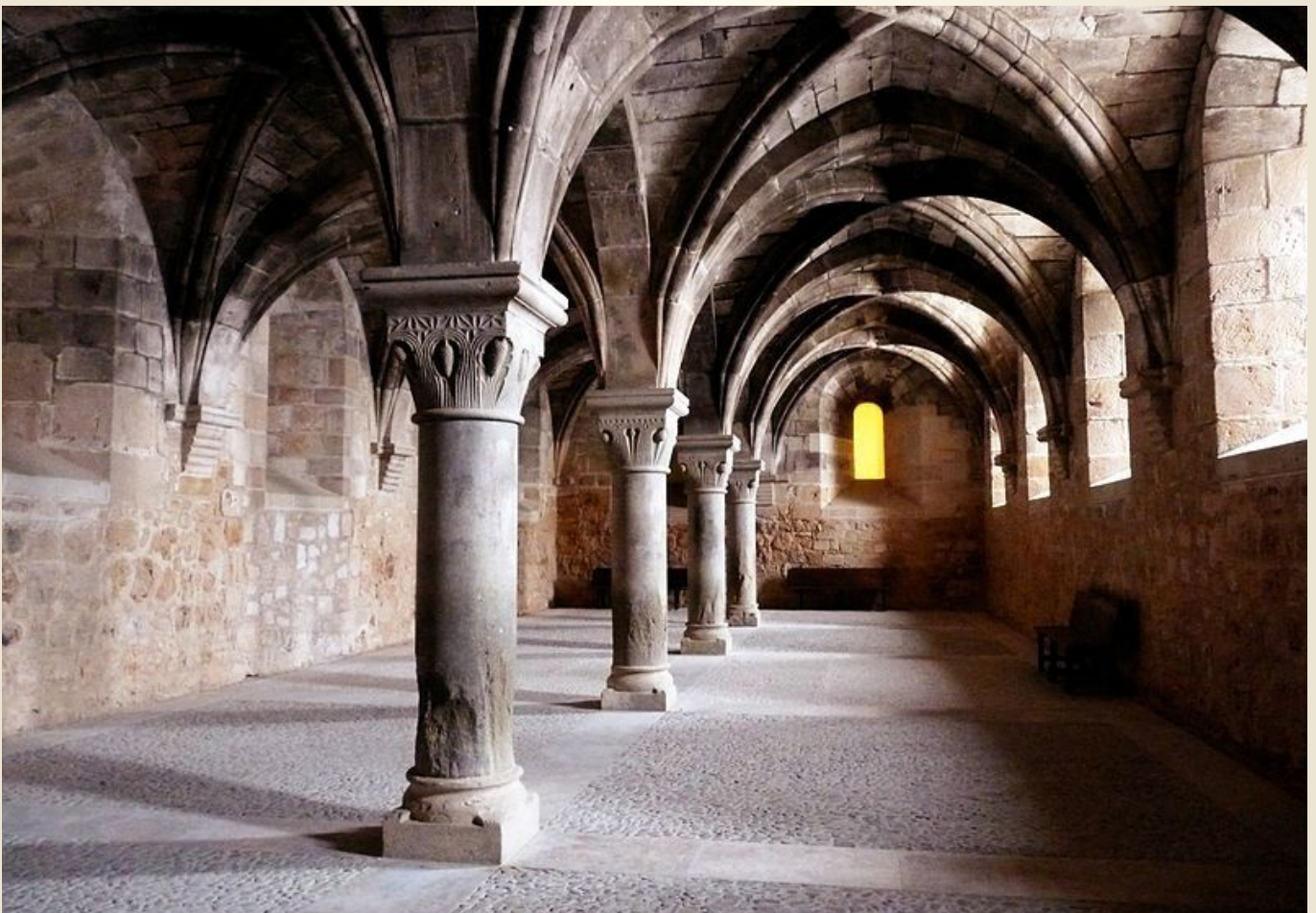
Monasterio de Santa Mª de Huerta, donde el rey de Castilla Fernando III y Jaime I de Aragón firmaron el pacto definitivo del divorcio.