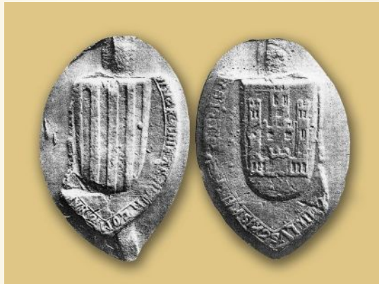
Anverso y reverso del sello heráldico de la reina de Aragón, esposa de Jaime I el Conquistador, Leonor de Castilla. La leyenda reza « Sigillum Alienoris regine Aragonum comitisse Barchinone et domine Montispessulani et illustris regis castelle filiae » (Sello de la esposa del rey de Aragón, conde de Barcelona y señor de Montpellier e hija del ilustre rey de Castilla). En el anverso se representa el escudo de los palos de Aragón y el reverso muestra el de Castilla.

b) Que en Ágreda se celebra la ceremonia civil y religiosa aceptada como boda y en Tarazona se celebran las velaciones (ceremonia en la que dan la bendición a la pareja, y la novia se consagra al estado matrimonial (« velatio nuptialis »)). Este razo-