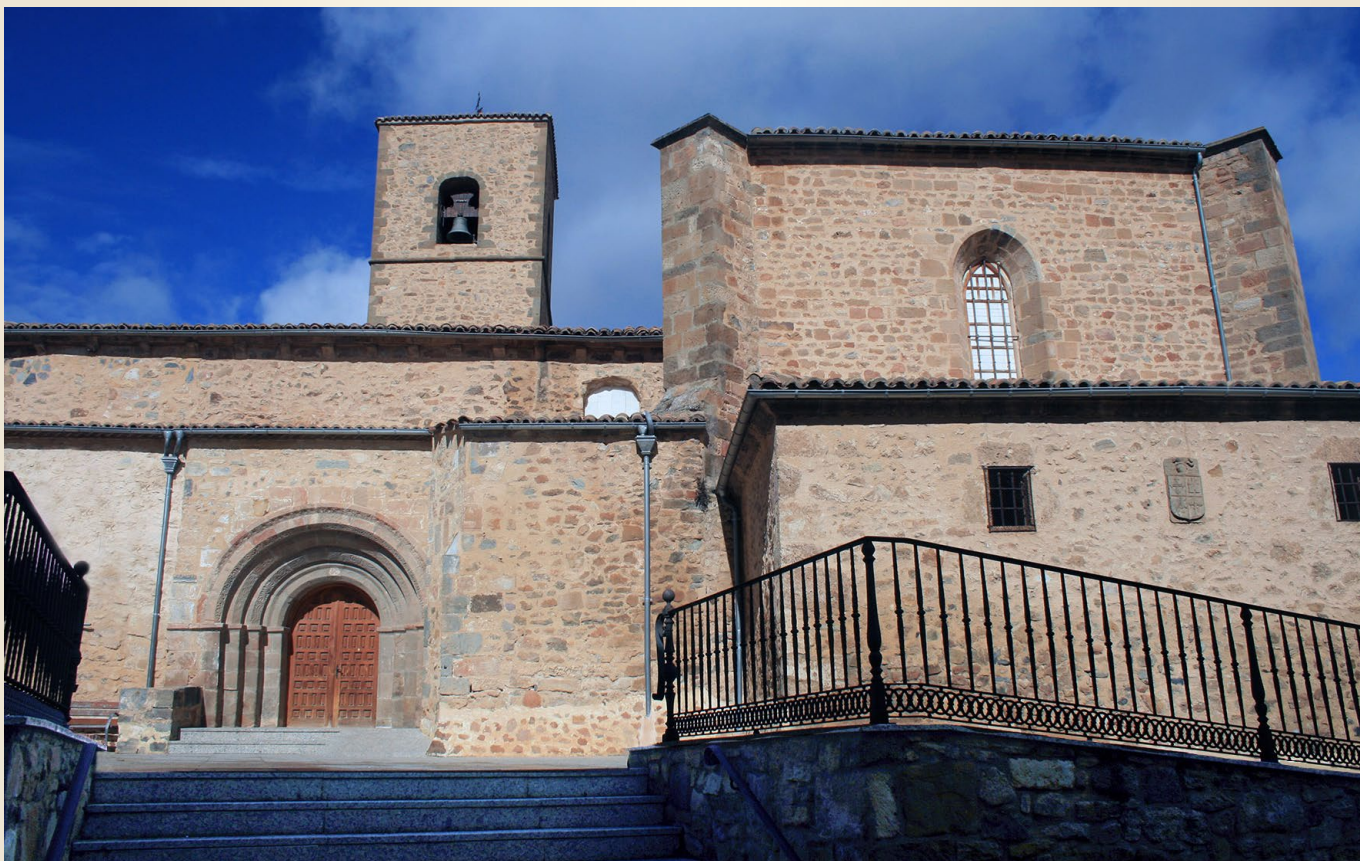
Ágreda. Iglesia de Ntra. Sra. de La Peña, lugar de la ceremonia.

Si analizamos, su consanguinidad proviene al casarse Alfonso VII con Berenguela de Barcelona, hija de Ramón Berenguer III.