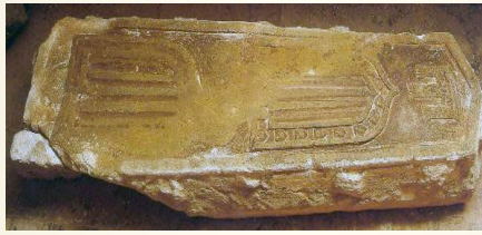
Lápida de la tumba de Alfonso, hijo de Leonor y Jaime I, en el Monasterio de Veruela.

Su hijo Alfonso, se casó el 23 de marzo de 1260 con Doña Constanza, hija y heredera de Don Gastón, vizconde de Barn, en Calatayud y murió el mismo año en que se casó sin dejar des-