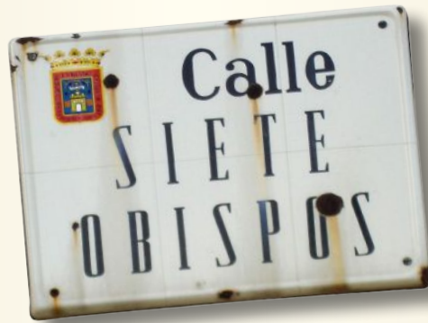
Placa de una calle de Tarazona.