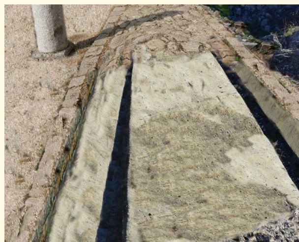
Infografía de la reconstrucción de una calzada con rodadas de carros en su estructura.