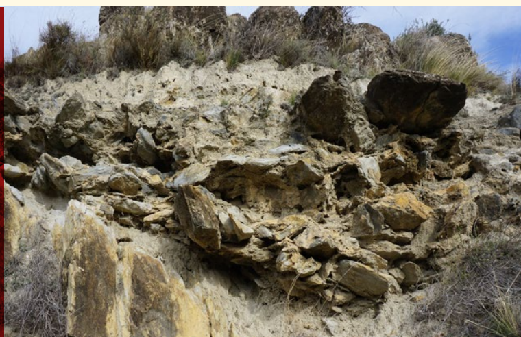
Restos del firme de la calzada romana de Pontarrón.