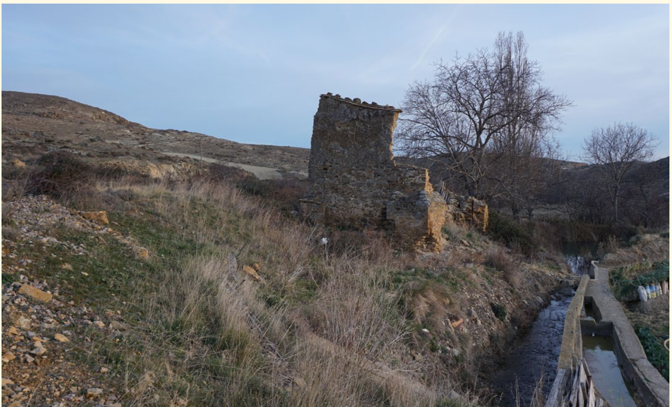
La calzada romana pudo discurrir por el camino viejo a Tarazona, a la izquierda de la Torre del Pelo.

Pero el descubrimiento de varias rodadas de tipo romano en el término de Pontarrón , así como que aparezca citada la vieja carretera pasando por la Torre del Pelo , en dos documentos fechados en 1664 12 y 1695 13 , documentos que fueron publicados en la Revista del Centro de Estudios de la Tierra de Ágreda nº 5 14 , nos ha hecho replantear el trazado de la antigua calzada romana.