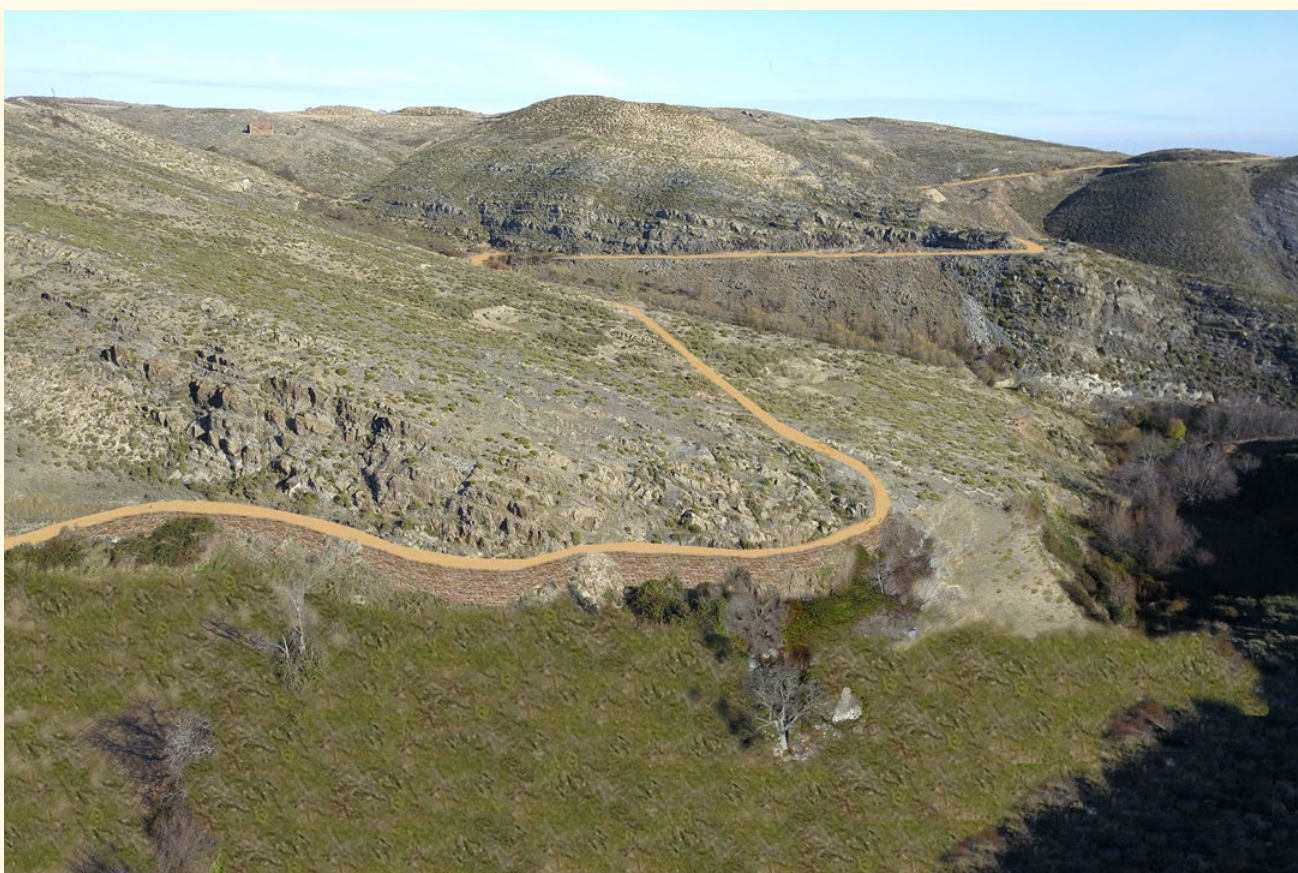
Infografía de lo que pudo ser el trazado de la calzada romana.