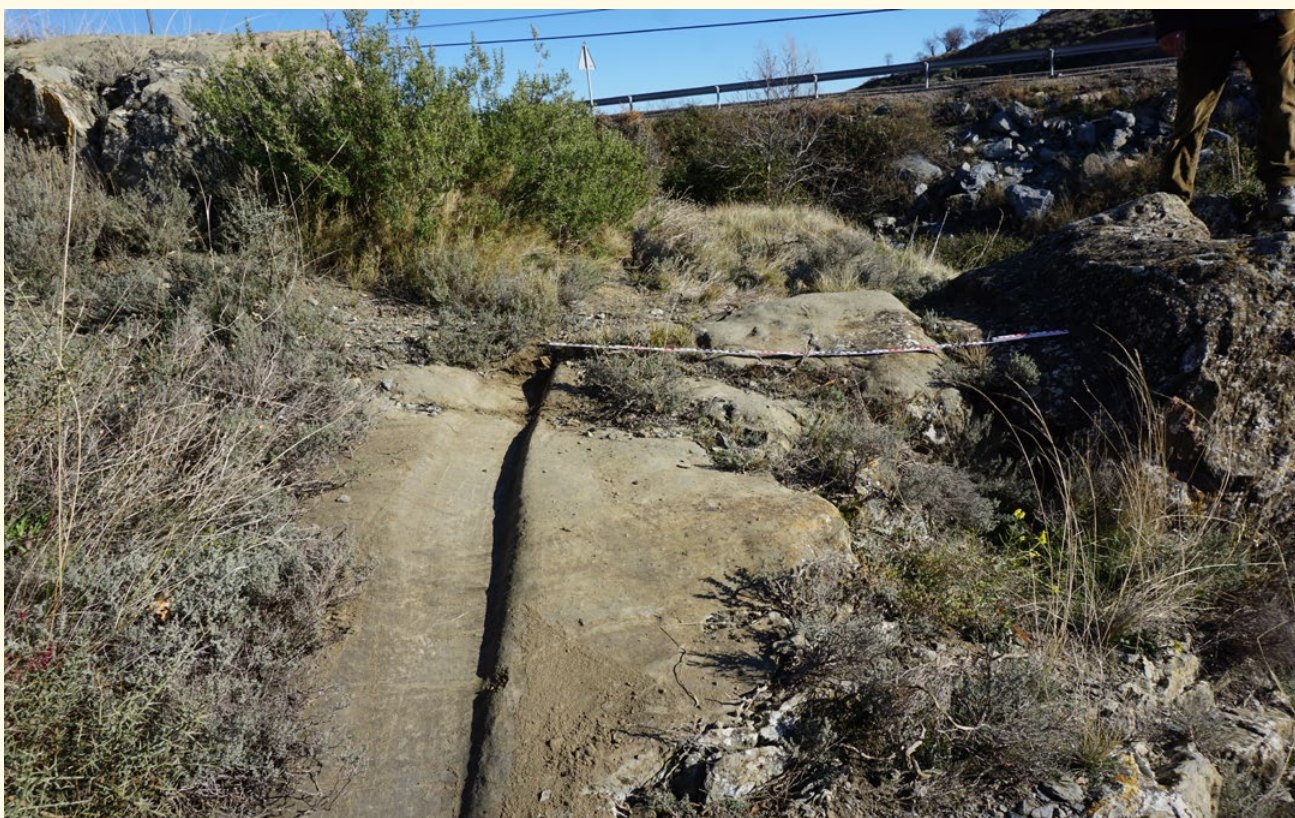
Rodada de tipo romano en el término de Pontarrón

La presentación de este hallazgo es, por tanto, una oportunidad colectiva y el comienzo de un trabajo del que se dará cuenta en los próximos meses cuando concluya dicho estudio científico.