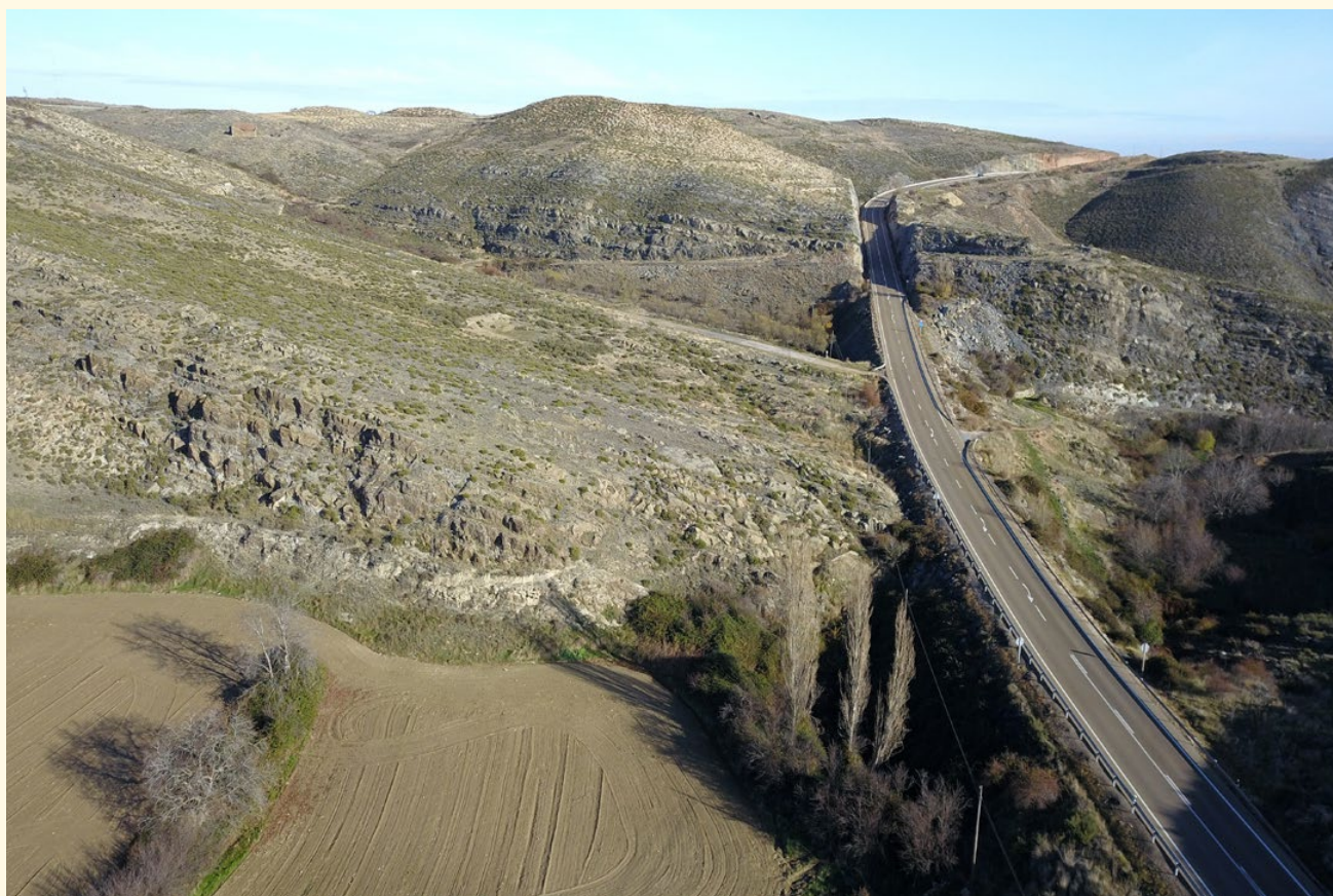
La antigua calzada romana pasaría por Pontarrón y seguiría el trazado de la antigua carretera.